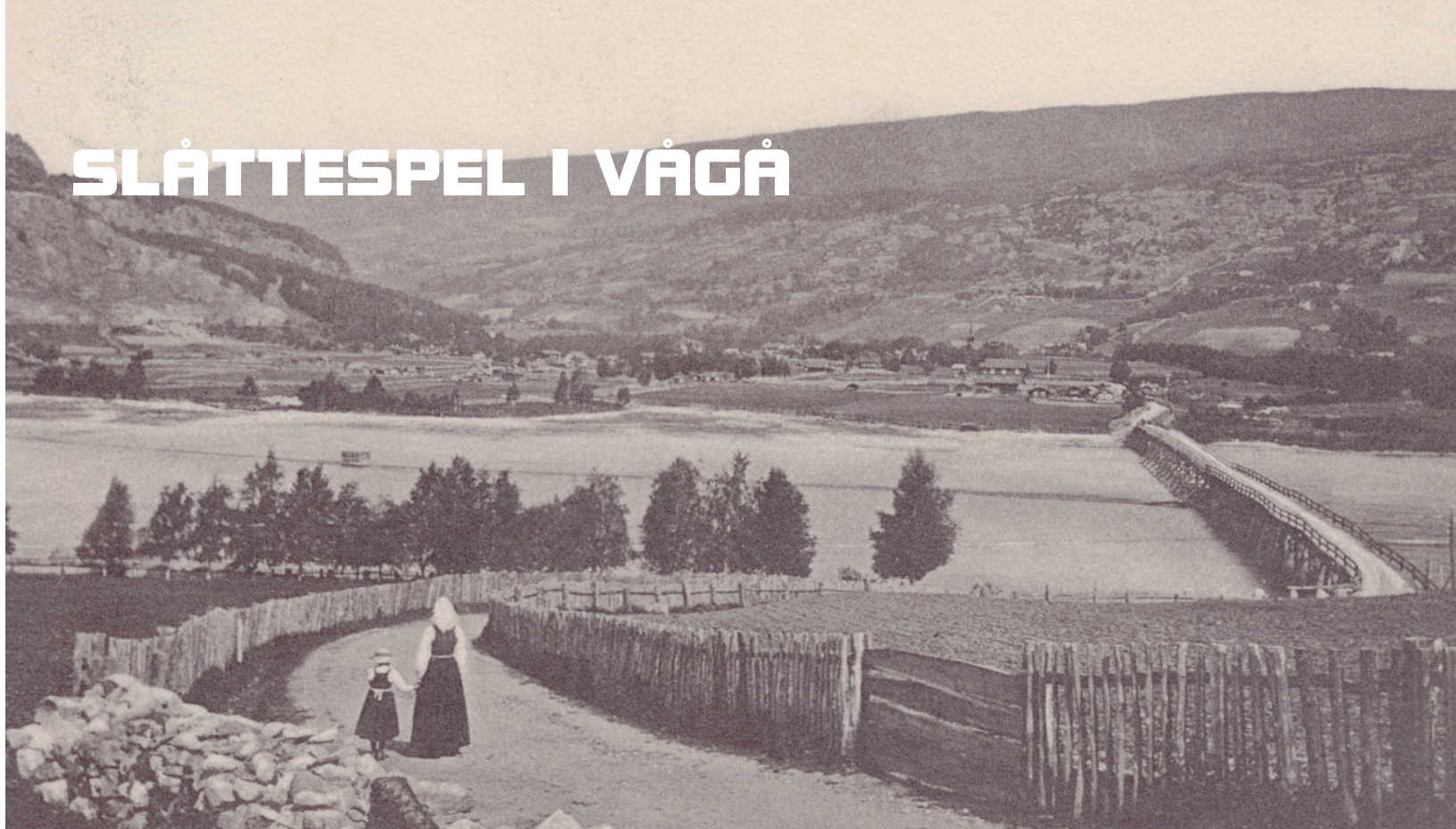
Parti fra Vaage