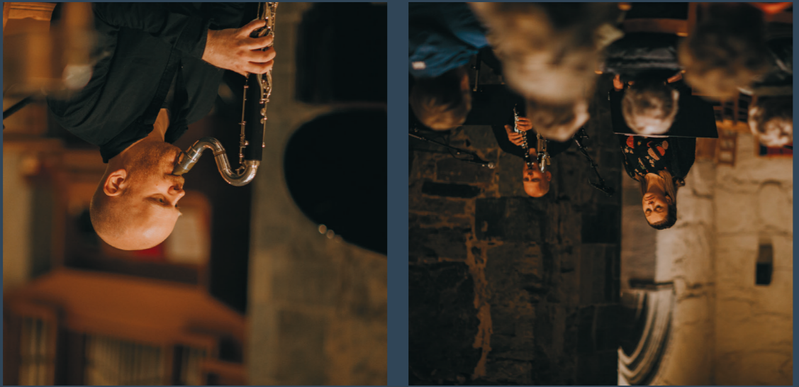
The Folk Music Archive for Rogaland County at the Ryfylke Museum menig og vent kald til kjende nye egne lokale varianter av julesalmer. Det ligger et ubrukt Hver til disse lokal. Ved å gå ut denne plate, ønsker me å bidra til at folk gjef om det frist et stort tal varianter. Det er yndt at folk i liten grad stidige og ikke. I dag er det mange lokale varianter av julesalmer, og del. Dette er songs som er i bruk i lokal. Det er mange som er ni. Tekster er adferdsomleg, men samstundes er det også hørd varer, vevr stemmer til menneske arkivopptak kring inn under huden repostert tre meg tekst. Det er mange arkivopptak og det er nae bygger på, og det er mange arkivopptak er det gode nye innspilg. er med tekster fra Rogaland der. Et var som kom ut i 1999, og julesalner fra kvart. Det var i 1999 at bokom. Den yngste bokom - enorm innstilling og av kjennet. Fra Rogaland. No gamle alle lokale varianter av det gamle julesalmer. Rtht man Moen gjorde i tid et